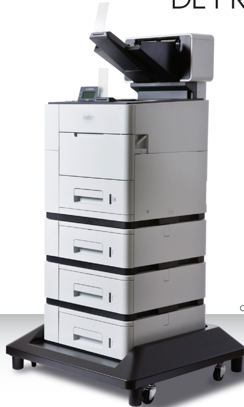
Configuration comprenant toutes les options

AUGMENTEZ LA PRODUCTIVITÉ DE VOTRE ENTREPRISE GRÂCE À L'IMPRIMANTE ULTRA-RAPIDE HL-S7000DN DE 100 PPM.